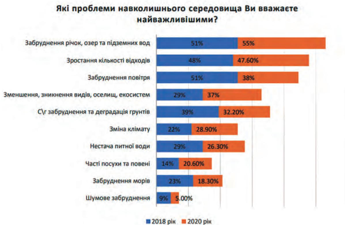
Рис. 1. Важливі екологічні проблеми для населення

Такі аргументи підтверджують важливість формування екологічної збалансованості розвитку ще на рівні територіальних громад шляхом впливу на екосвідомість населення через екологічну освіту, екологічну просвіту, впровадження дій, дотичних до екосвідомості (екологічний