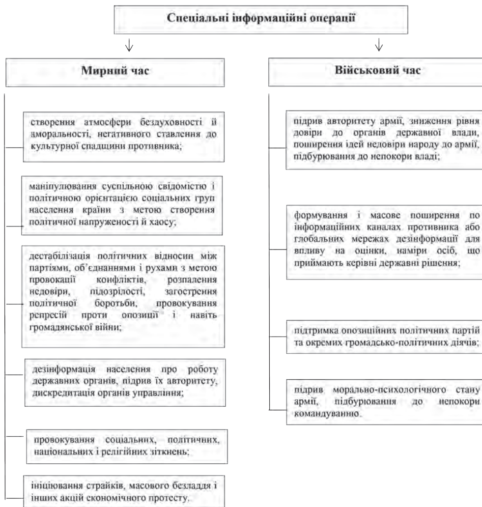
Рис. 1. Основні цілі спеціальних інформаційних операцій

Вказана СІО дала можливість військам РФ на початку 2014 року під час політичної кризи в Україні здійснити військову інтервенцію та встановити фактичний військовий контроль на території АР Крим. Після чого РФ спробувала застосувати зазна-