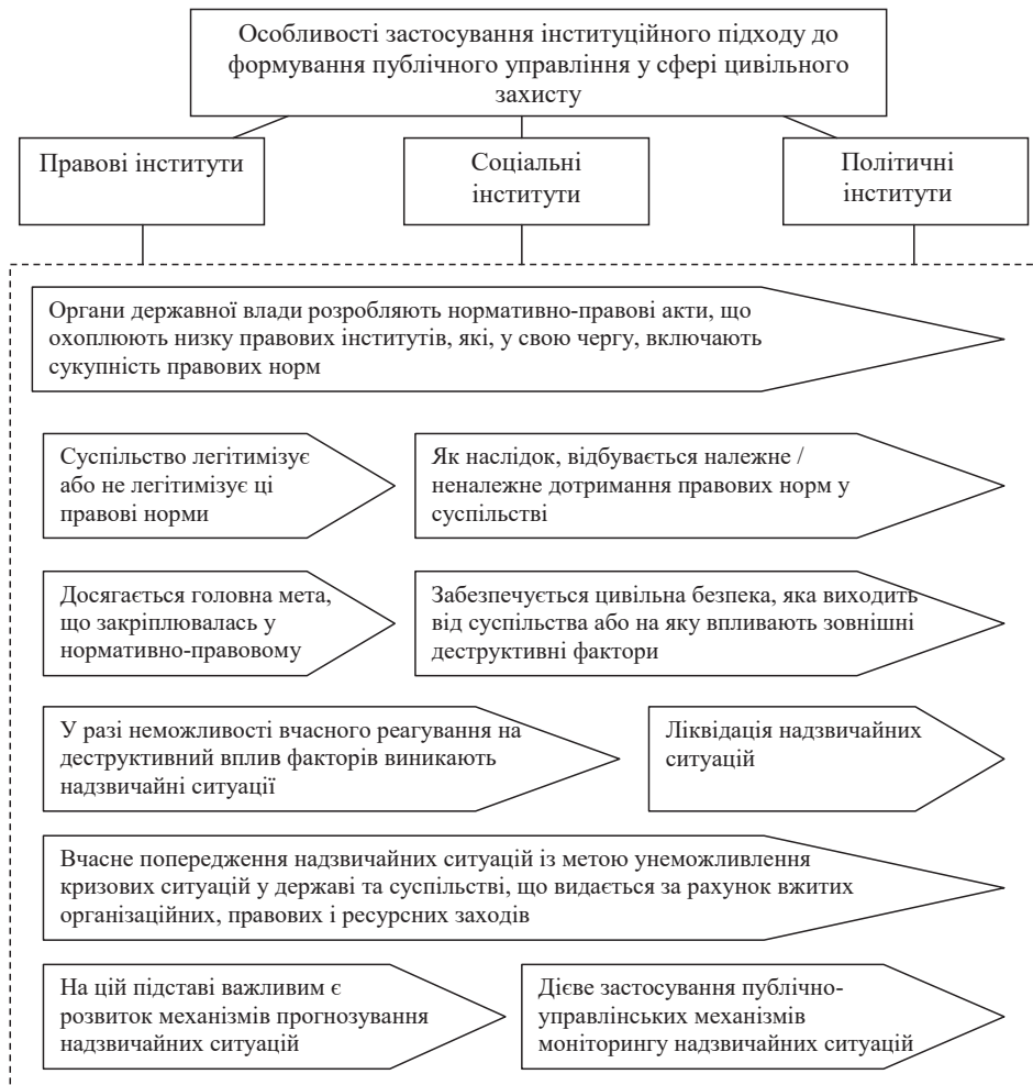
Рис. 2. Особливості застосування інституційного підходу до формування публічного управління у сфері цивільного захисту