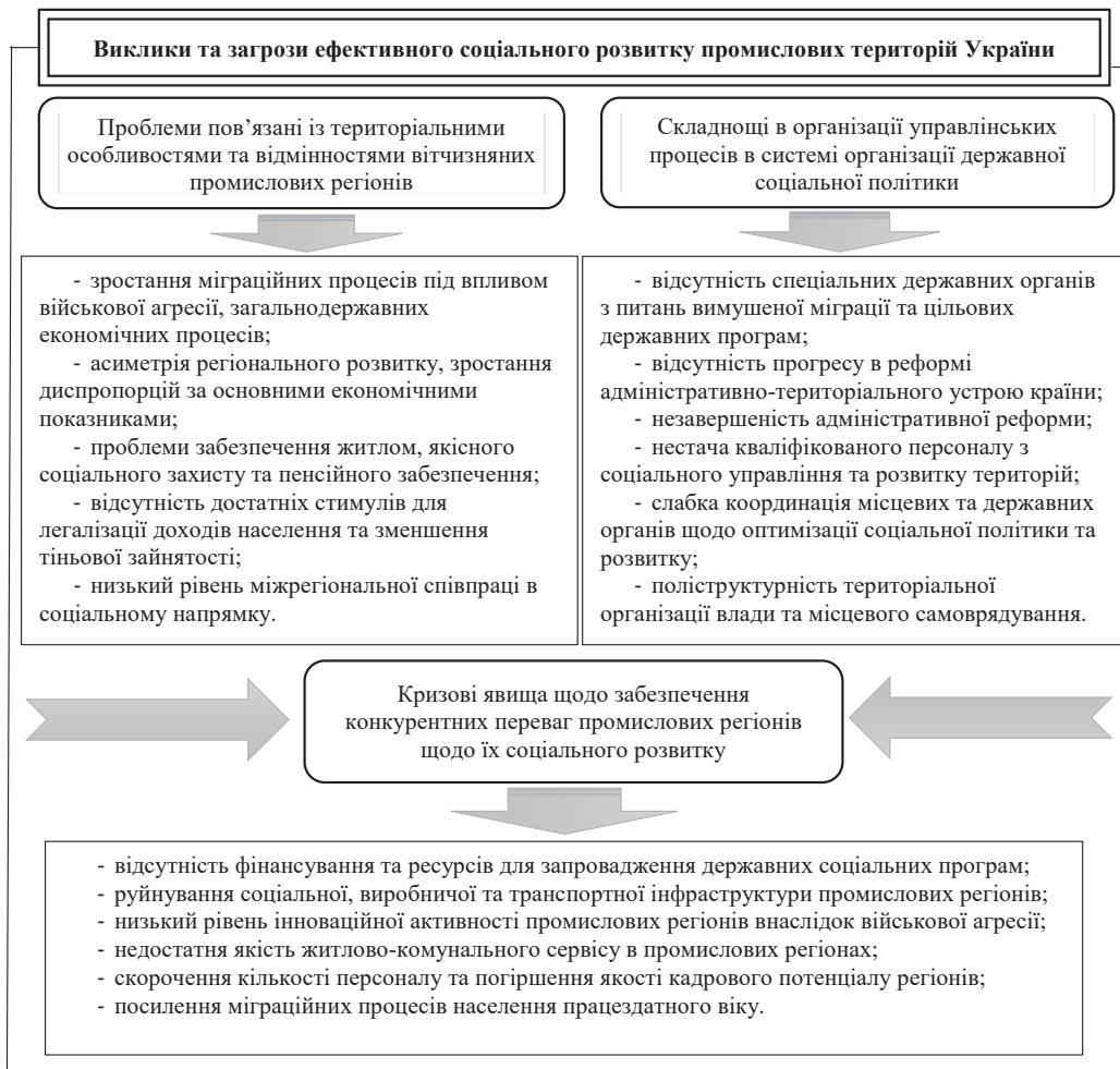
Рис. 3. Виклики та загрози ефективного соціального розвитку промислових регіонів України