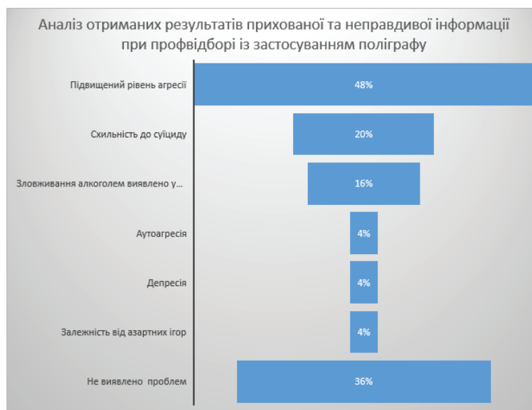
Рис. 2. Аналіз отриманих результатів прихованої та неправдивої інформації при профвідборі із застосуванням поліграфу (N=25)