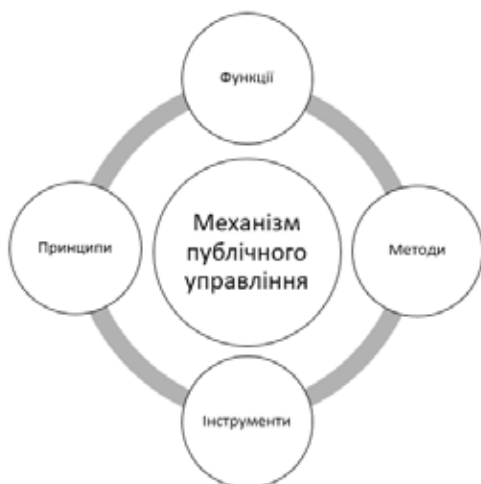
Рис. 1. Структура механізму публічного управління

Проведений аналіз дає змогу визначити, що механізм публічного управління являє собою цілісну систему принципів, функцій, методів та інструментів застосування яких суб'єктами управління забезпечує досягнення поставлених цілей у сфері публічного управління.