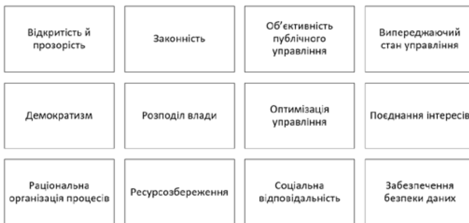
Рис 2. Принципи публічного управління

Складено автором на основі [15, с. 51–57]