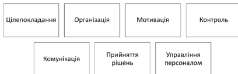
Рис. 3. Функції публічного управління

Основні групи методів публічного управління представлено на рис. 4. На думку О. Вдовиченка під впливом зовнішнього контексту відбуваються процеси зростання свідомості й організованості громадян, що в свою чергу підвищує важливість застосування методів переконання й заохочення (група соціально-психологічних, виховних й організаційно-розпорядчих методів), як наслідок від-