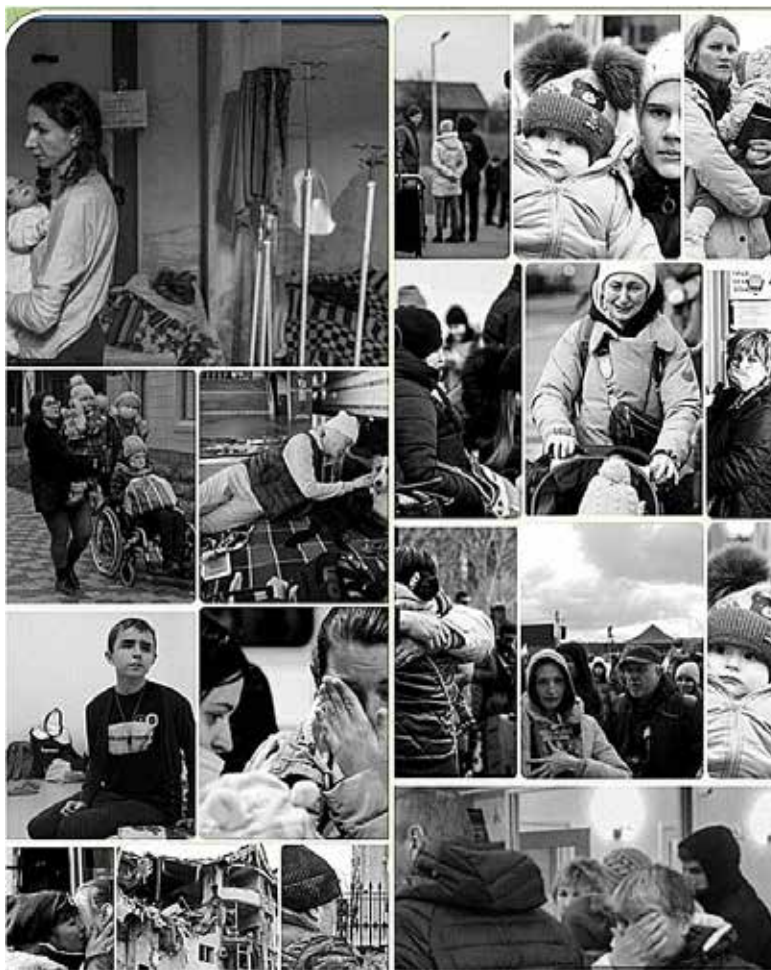
Рис. 2. Фотознімки випадкових біженців і мігрантів з України