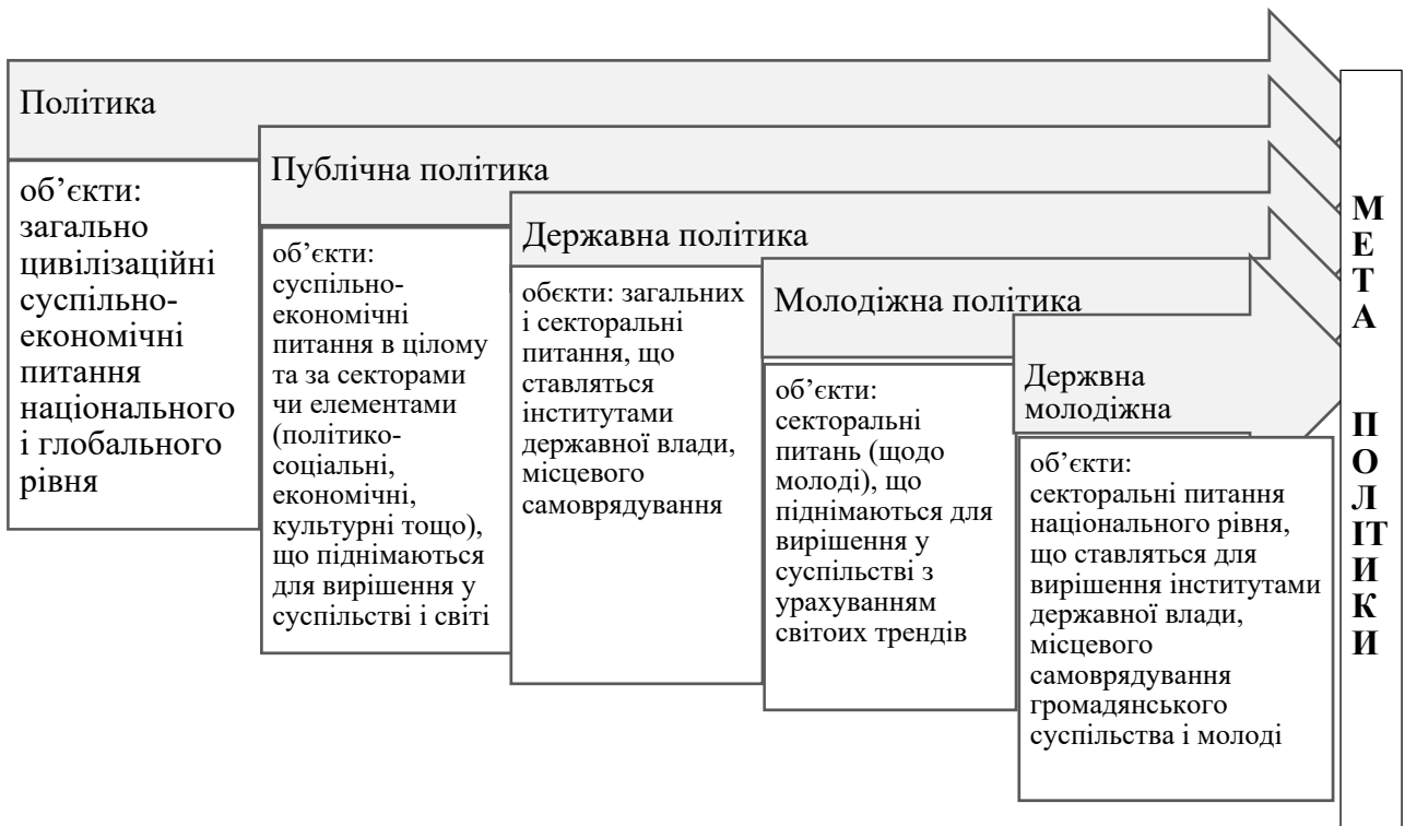
Рис. 2. Категоріальний ряд політик, в залежності від масштабу, та декомпозиція об'єктів публічного управління щодо молодіжної сфери

молодіжної інфраструктури, спеціалістів з молодіжної роботи, бізнес-партнерів та активістів громадського сектору тощо;