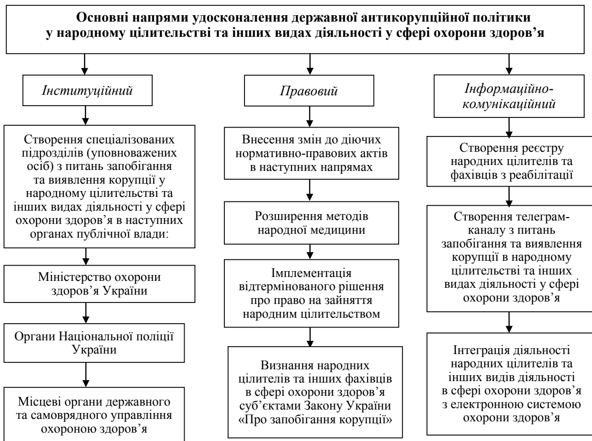
Рис. 2. Напрями удосконалення державної антикорупційної політики у народному цілительстві та інших видах діяльності у сфері охорони здоров'я

цію у сфері охорони здоров'я» не враховує технологій соціальної реабілітації, що вимагає або внесення певних змін в зазначений нормативно-правовий акт, або створення окремого законопроекту про соціальну реабілітацію [11]. Зазначений нормативно-правовий акт повинен окреслити поле соціальної реабілітації як в рамках сфери охорони здоров'я, так і інших сферах суспільного буття. У випадку зазначених змін в нормативно-правовій базі буде інституціоналізовано та легітимізовано ще один великий пласт діяльності, де особи без формалізованих навичок будуть надавати реабілітаційні послуги широкому колу осіб, що потребують реабілітації. Сьогодні соціальна реабілітація знаходиться в парафії центрів соціального обслуговування та спеціалізованих соціальних служб і вона не є домінуючою в системі соціального обслуговування. Прийняття низки нормативно-правових актів, що сприятиме підвищенню статусу процесу соціальної реабілітації, зокрема і в сфері охорони здоров'я, створить сектор корупційних ризиків, на які треба відповідати як українському суспільству, так і відповідним державним контролюючим органам.